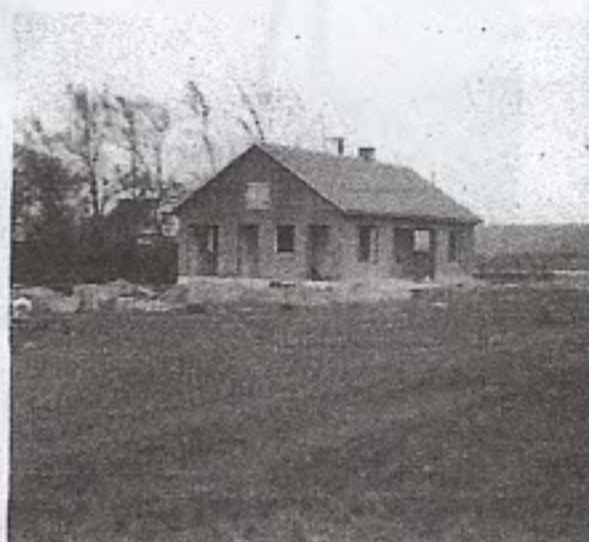
Det nye klubhus.

Vi holdt også selv rent mellem beplantningen om anlægget i nogle år. Der var kun én håndboldbane i